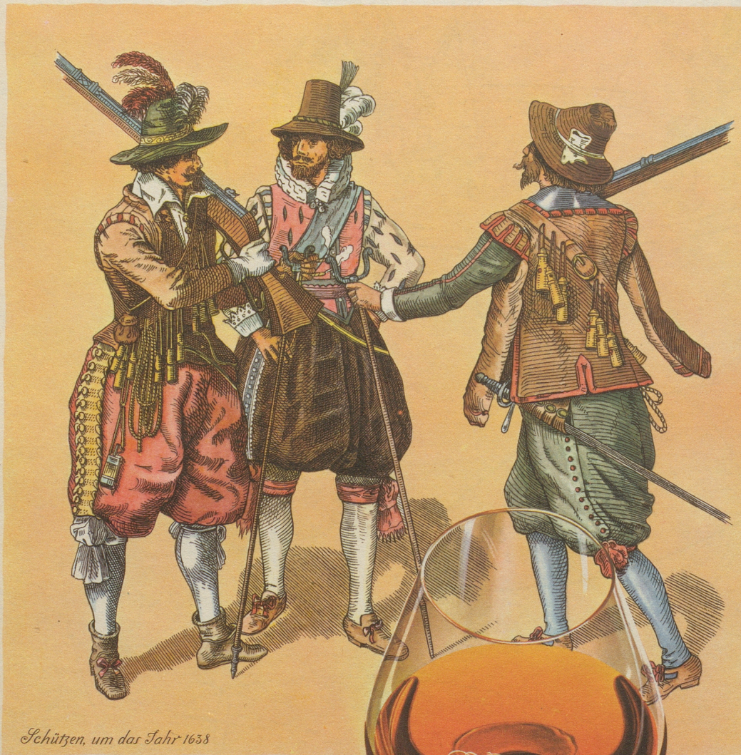
Schützen, um das Jahr 1638

In jedem Glase Asbach Uralt sind alle guten Geister des Weines