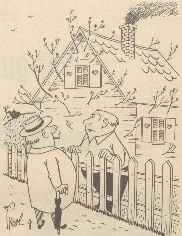
«Ich hätte doch kein Holzhaus bauen sollen; für die Jahreszeit ist das Holz noch zu jung...»

Ein Mann kommt in das Bureau des Stationsvorstehers. «Sie müssen verbieten, daß der