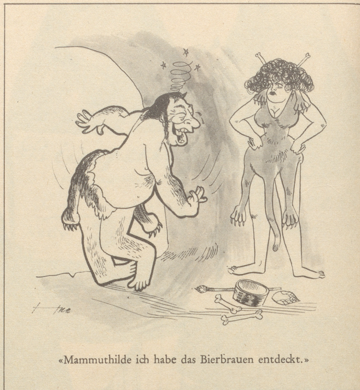
«Mammuthilde ich habe das Bierbrauen entdeckt.»

Arntzens Klaviermarathon denkt. Ich glaube, wenn ich mir den Arno anhörte, könnte ich noch viel länger schluchzen.