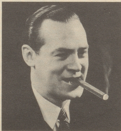
Wenn ich meinen Freunden im Ausland Corona E3 Moderna anbiete, mache ich allen immer eine große Freude.

die Zigarre im Aufschwung weil leicht, aromatisch und mild