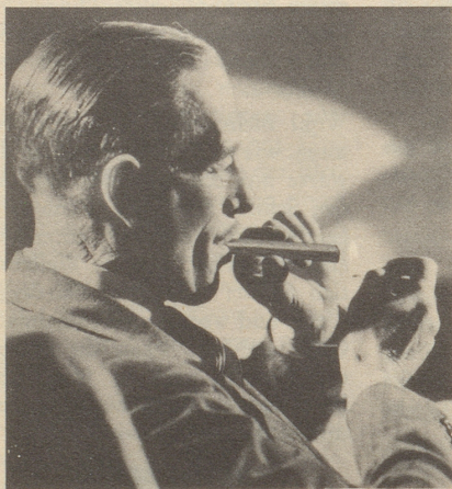
Ich muß zugeben, ich bin ein verwöhnter Raucher. Deshalb bevorzuge ich Corona E3 Moderna, die feine Zigarre.