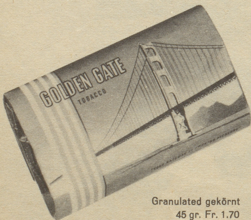
Granulated gekörnt 45 gr. Fr. 1.70

der ideale Pfeifentabak für junge und unternehmungslustige Männer. Amerikanischer Typ, sehr mild, mit reichem Aroma und kühlem Rauch.