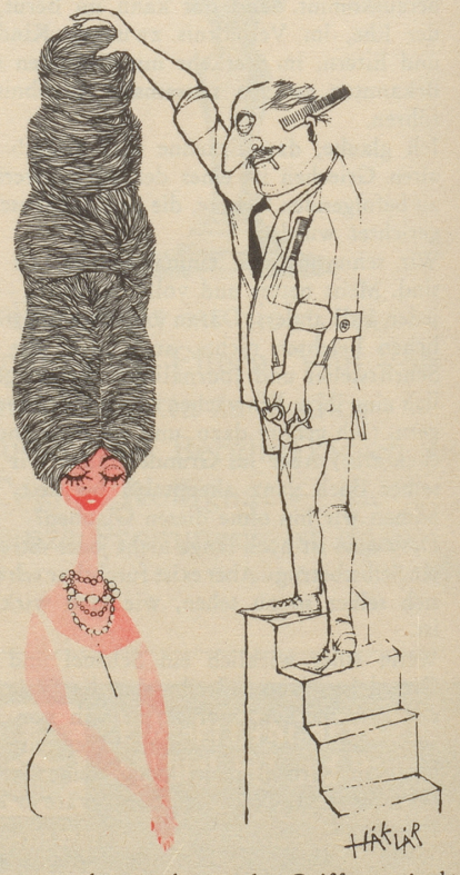
Immer schwerer hat es der Coiffeur mit der mehrstöckigen Frisur!

Du weißt vielleicht was physikalische Therapie ist. Ich weiß es nämlich auch; aber das will nicht sagen, daß es alle wissen! Ich arbeite in einem Spital an der Porte und gebe Auskunft am Telephon und am Schalter. Viele Leute gehen ein und aus. Einige kennen den Weg zu diesem Institut und andere fragen: «Fräulein, wo geits düre zur philosophische Abteilig?» Ein anderer meint: «Ich