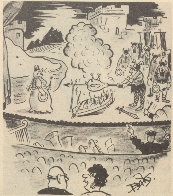
«Es ist die letzte Lohengrin-Vorstellung der Saison, sie brauchen nun den Schwan nicht mehr!»

Dem gescheiten kleinen Druckfehlerteufel des «Alg. H'blad», der uns zu dieser kleinen Exkursion ins sogenannte «liberalisierte» Polen Gelegenheit gab, ein dank je wel! Um aber doch nicht ganz ohne Perspektiven zu endigen: Jenen Freunden in Polen, die gefangen hinter vergitterten Fenstern oder außerhalb der Eisenstäbe in steter Bedrängnis leben müssen, sich vergeblich nach einer Freiheit sehnd, in der ständig zu atmen, die unangestastet und gesichert zu besitzen wir das Glück haben ... jenen Freunden (die nichts mit den Verrätern am polnischen Volk gemein haben wollen, die, von einem Gomulka gesandt, unter allerlei Vorwänden bei uns im Westen herumlungern) ... ihnen rufen wir zu: Noch ist Polen nicht verloren .. trotz Gomulka, trotz PPR, trotz der Sowjetunion .. weil es euch gibt, Ihr Tapferen! Wir danken euch! Pietje