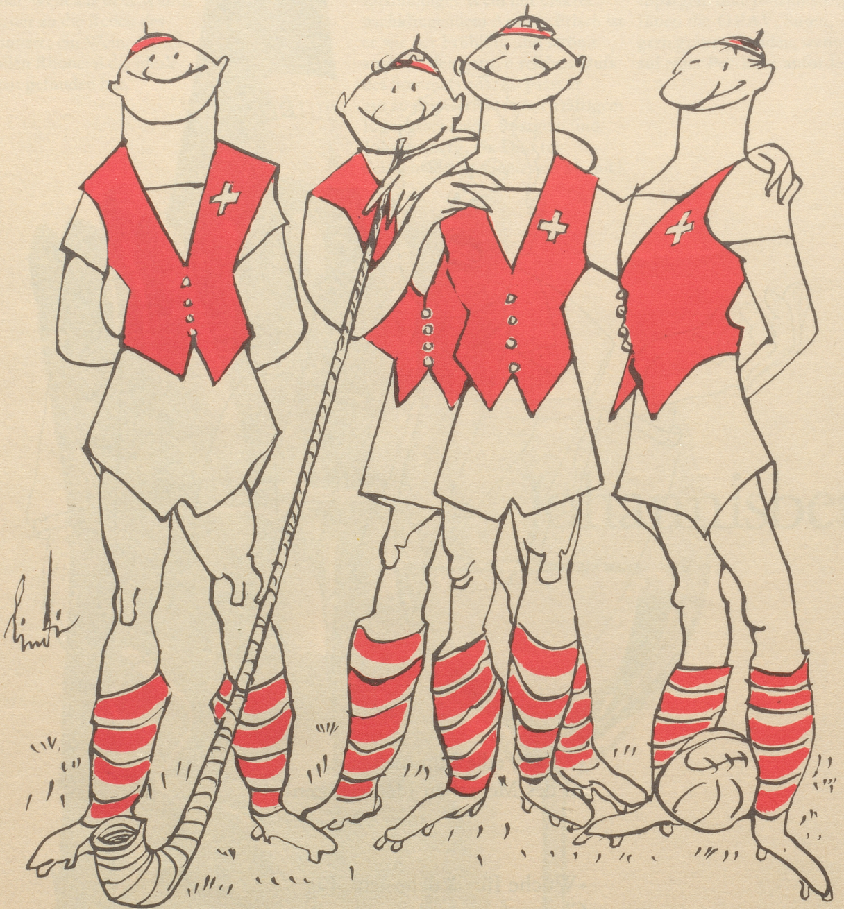
Eusers Schile für Chile