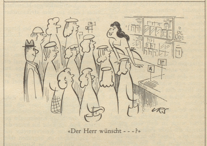
«Der Herr wünscht - - -?»

hoch angesehen war, sie solle doch zu Hof gehn, um ein gutes Beispiel zu geben. «Ich habe ein besseres Beispiel», sagte sie, «wenn ich mich vom Hof fernhalte.»