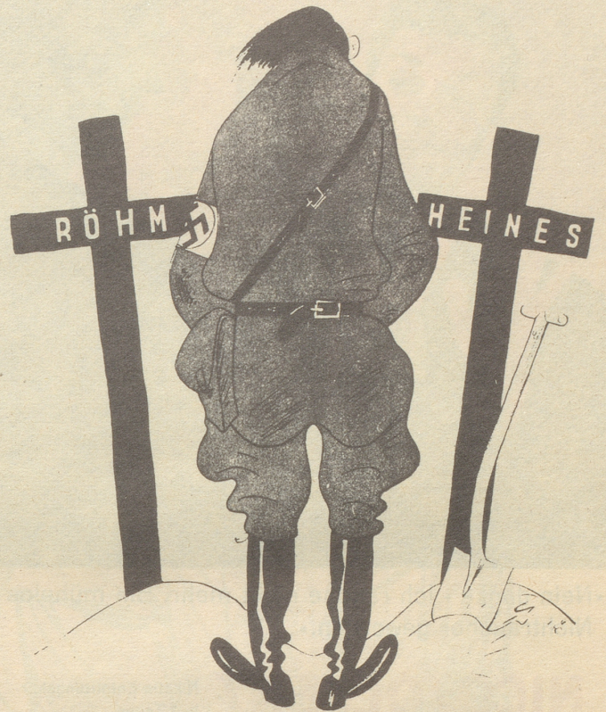
Und der Führer sprach: Nur der Tod kann uns trennen!