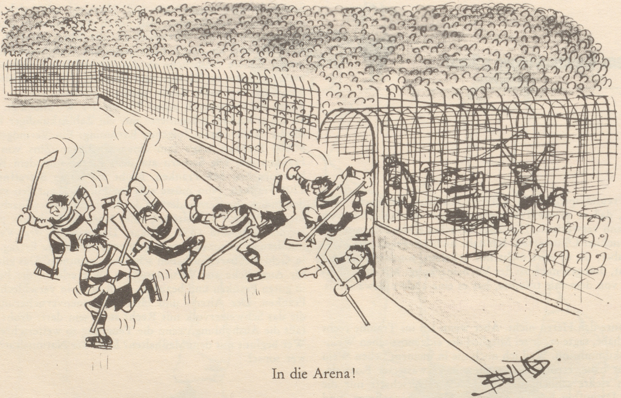
In die Arena!