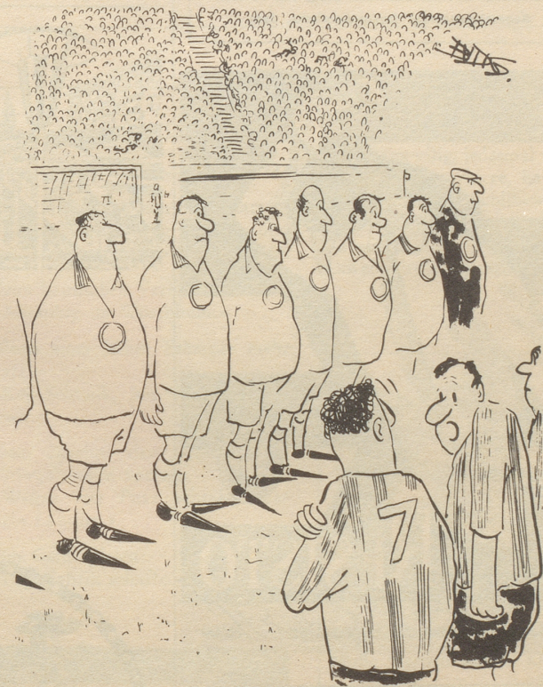
«Die spitzen Schuhe geben mir zu denken!»