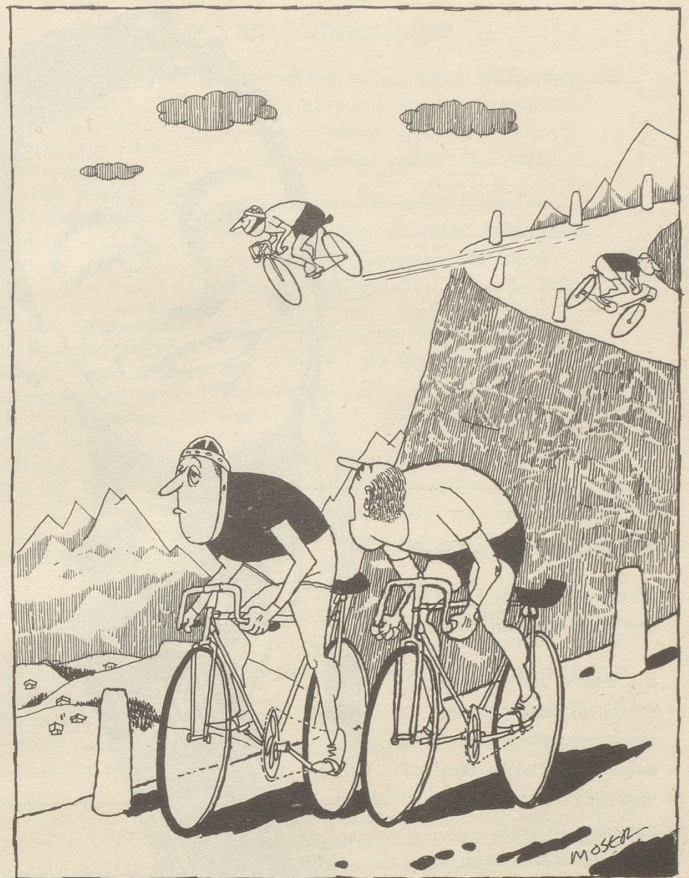
«Das ist ein früherer Bahnspezialist und Schweizermeister im Fliegerrennen! Man nannte ihn den Düsenjäger ...»

Als der Maler Ferdinand Hodler endlich finanziell auf einen grünen Zweig kam, standen langjährige Gewohnheit und angeschlagene Gesundheit einem üppigeren Lebenswandel im Wege. «Man kann halt nicht nachessen», sagte Hodler melancholisch. fh