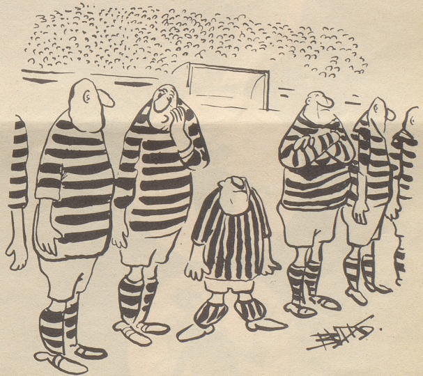
«Er sagt, Längsstreifen machen ihn größer!»

Sie auf unsere Treppenstufe auf!» Beim Ausgang dann: «Passen Sie auf Ihre Zunge auf!» Beim Ausgang irgendwo: «Bitte Tür leise schließen, auch wenn Ihr Antrag abgelehnt worden ist!» Beim Kaseneingang des Steueramtes im schwarzwäldischen Freudenstadt: «Grüß Gott, tritt ein, bring Geld herein, es wird zum Nutzen aller sein.» Im Steueramt Nürnberg unter dem Bild eines Mannes, der mit der einen Hand nimmt und mit der andern gibt, das lateinische Zitat: «Do ut des.» Also: «Ich gebe, damit auch du wieder gibst.» Und in der Eingangshalle des Finanzamtes Frankfurt-Höchst Goethes