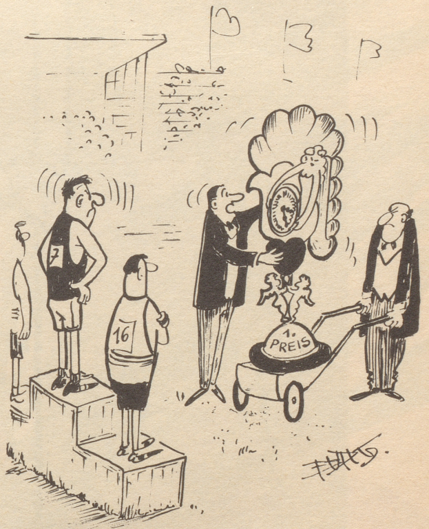
«Er sagt, eine Armbanduhr wäre ihm lieber!»