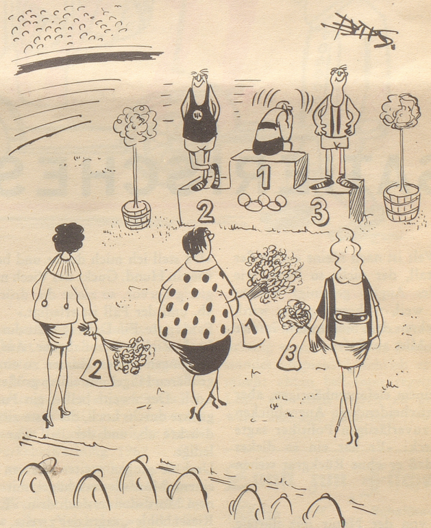
Kurz vor dem Siegeskuß

zur Aufnahmeprüfung, bald besser, bald weniger gut vorbereitet. Zur Vorbereitung gehört auch, was eine Lehrkraft an einer Bezirksschule ihren Schülerinnen zu sagen pflegt: «Wenn ihr nach Aarau ins Seminar kommt, werdet ihr