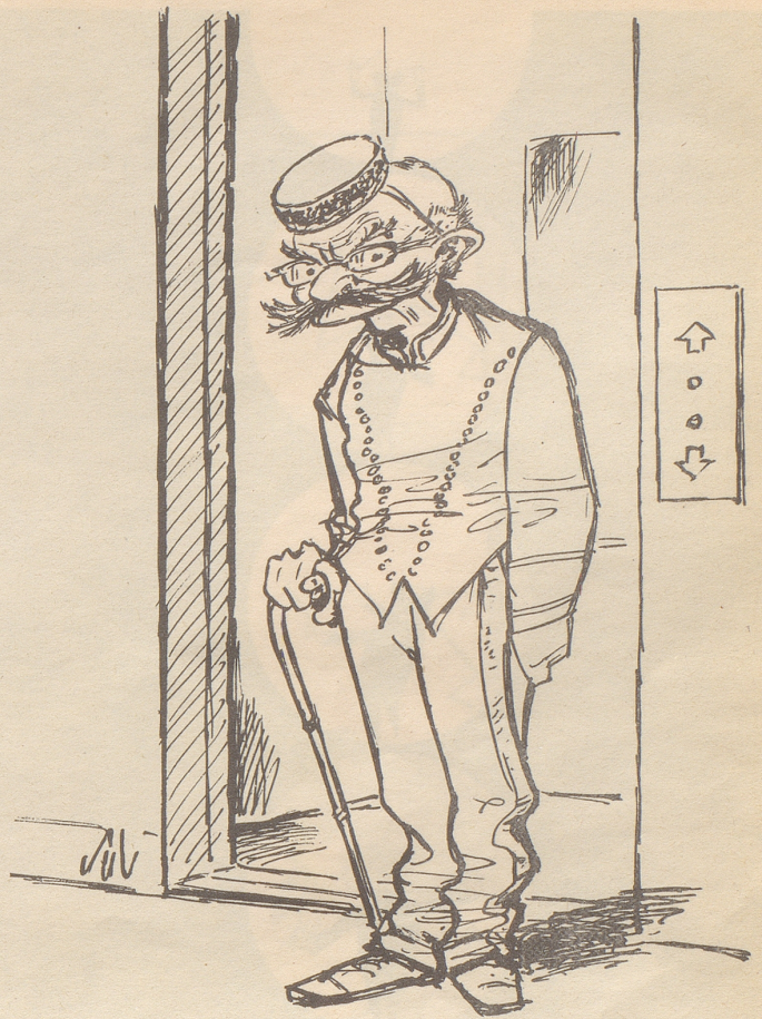
Liiftboy im Zeitalter des Personalmangels