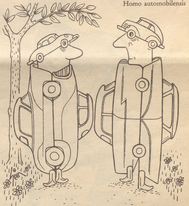
«Kreislauf, sagt der Doktor, Motor drosseln, Beine einschalten, und wieder zu Fuß laufen!»