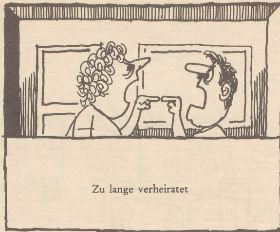
Zu lange verheiratet