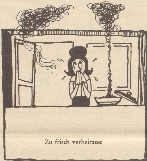
Zu frisch verheiratet