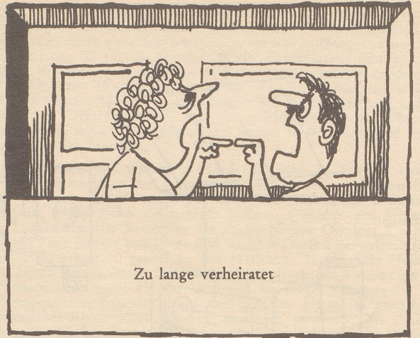
Zu lange verheiratet