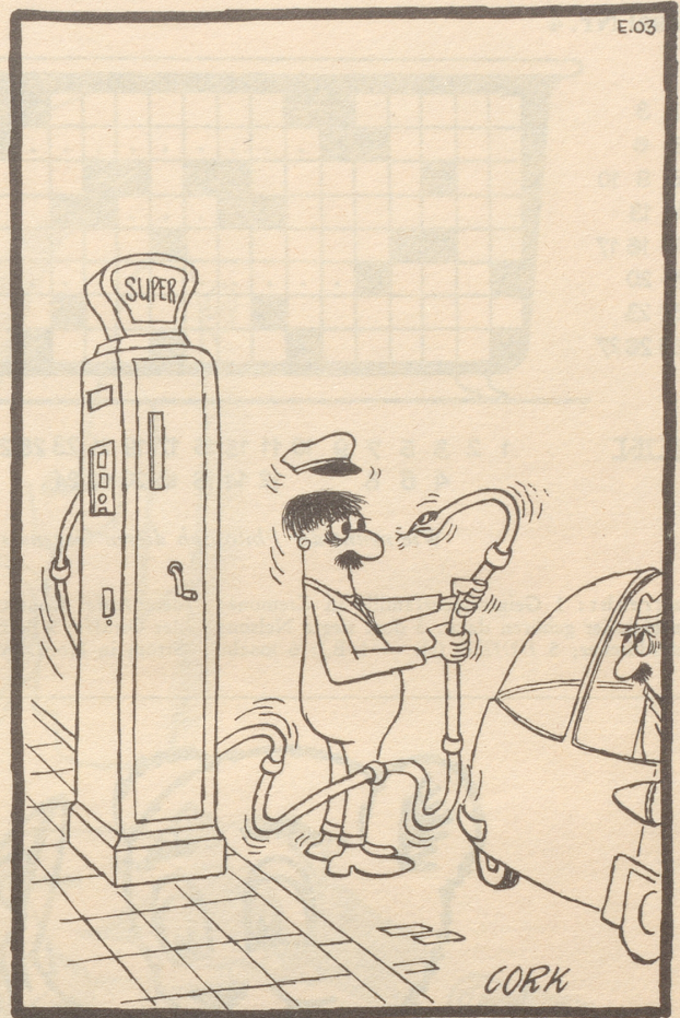
Verzell Du das keim Tankwart!

Einige Lehrer sollen sich daraufhin vorgenommen haben, alles daran zu setzen, nun erst recht lange am Leben zu bleiben.