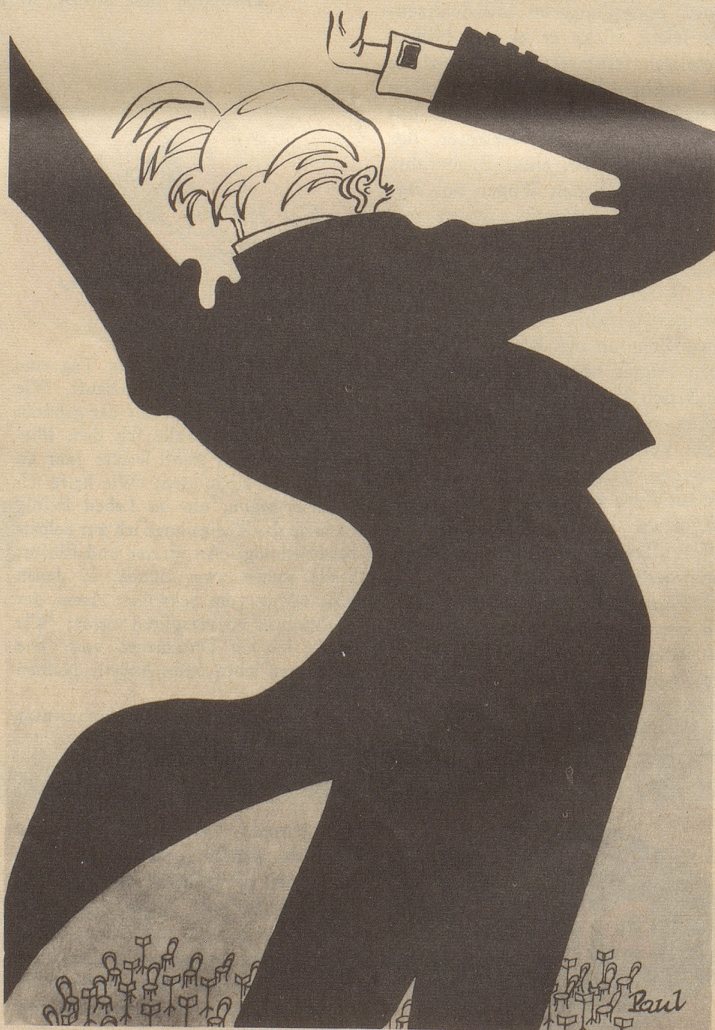
Dirigent probt Gesten

Unvergessen ist die Zürcher Gemeinderatssitzung, an welcher der