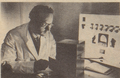
Wissenschaftlich bewiesen: Die Aufbaustoffe von Neo-Silvikrin gelangen bis in die Haarwurzeln!

Bestimmt haben auch Sie schon dies oder jenes unternommen, um den Haarausfall aufzuhalten... und das Ergebnis??? Jetzt endlich brauchen Sie nicht mehr den Mut zu verlieren, denn es gibt ja Neo-Silvikrin — die auf der ganzen Welt anerkannte biologische Haarnahrung! Die erste Voraussetzung für die Wirksamkeit eines Haarpräparates ist: Seine Wirkstoffe müssen bis in die Haarwurzeln gelangen!