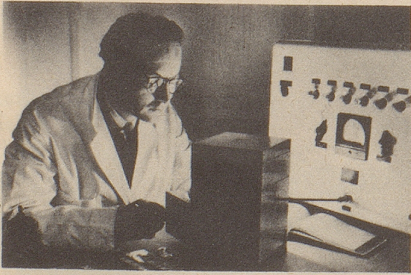
Wissenschaftlich bewiesen: Die Aufbau- stoffe von Neo-Silvikrin gelangen bis in die Haarwurzeln!

Bestimmt haben auch Sie schon dies oder jenes unternommen, um den Haarausfall aufzuhalten... und das Ergebnis??? Jetzt endlich brauchen Sie nicht mehr den Mut zu verlieren, denn es gibt ja Neo-Silvikrin — die auf der ganzen Welt anerkannte biologische Haarnahrung! Die erste Voraussetzung für die Wirksamkeit eines Haarpräparates ist: Seine Wirkstoffe müssen bis in die Haarwurzeln gelangen!