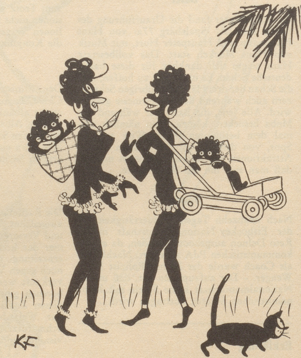
«Bekommt ihr denn noch keine Entwicklungshilfe?»

Ein junger Maler stellt aus: «Was kostet die Landschaft da?» «Siebzig Franken.» «Was? – Dafür bekomme ich ja ein Paar Schuhe!»