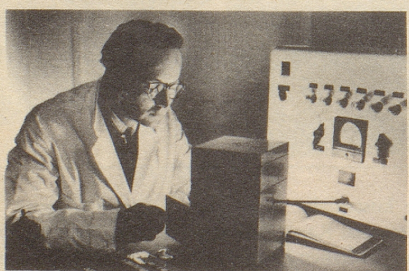
Wissenschaftlich bewiesen: Die Aufbaustoffe von Neo-Silvikrin gelangen bis in die Haarwurzeln!

Bestimmt haben auch Sie schon dies oder jenes unternommen, um den Haarausfall aufzuhalten... und das Ergebnis??? Jetzt endlich brauchen Sie nicht mehr den Mut zu verlieren, denn es gibt ja Neo-Silvikrin — die auf der ganzen Welt anerkannte biologische Haarnahrung! Die erste Voraussetzung für die Wirksamkeit eines Haarpräparates ist: Seine Wirkstoffe müssen bis in die Haarwurzeln gelangen!