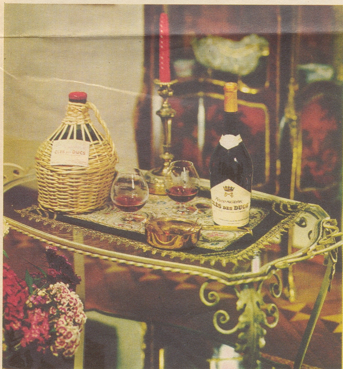
Armagnac CLES DES DUCS

hat Stil und Temperament darum ist er auch der erklärte Favorit soignierter Kenner!