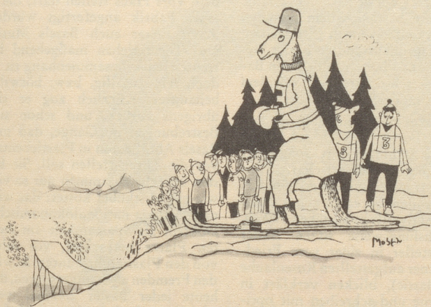
«Ich möchte nicht als unsportlich gelten - aber irgend etwas scheint mir bei diesem australischen Springer nicht zu stimmen!»