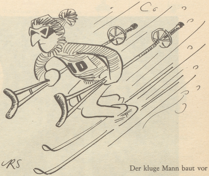
Der kluge Mann baut vor

Und das gedacht: Blühender Osthandel mit – Schmalz. Kobold