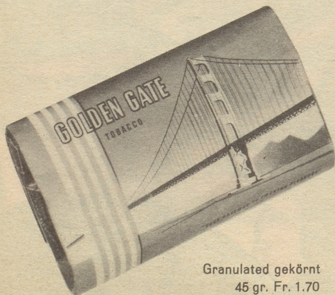
Granulated gekörnt 45 gr. Fr. 1.70

der ideale Pfeifentabak für junge und unternehmungslustige Männer. Amerikanischer Typ, sehr mild, mit reichem Aroma und kühlem Rauch.