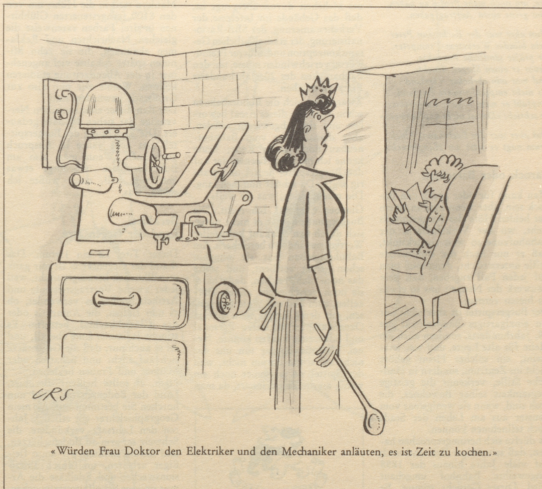
«Würden Frau Doktor den Elektriker und den Mechaniker anläuten, es ist Zeit zu kochen.»