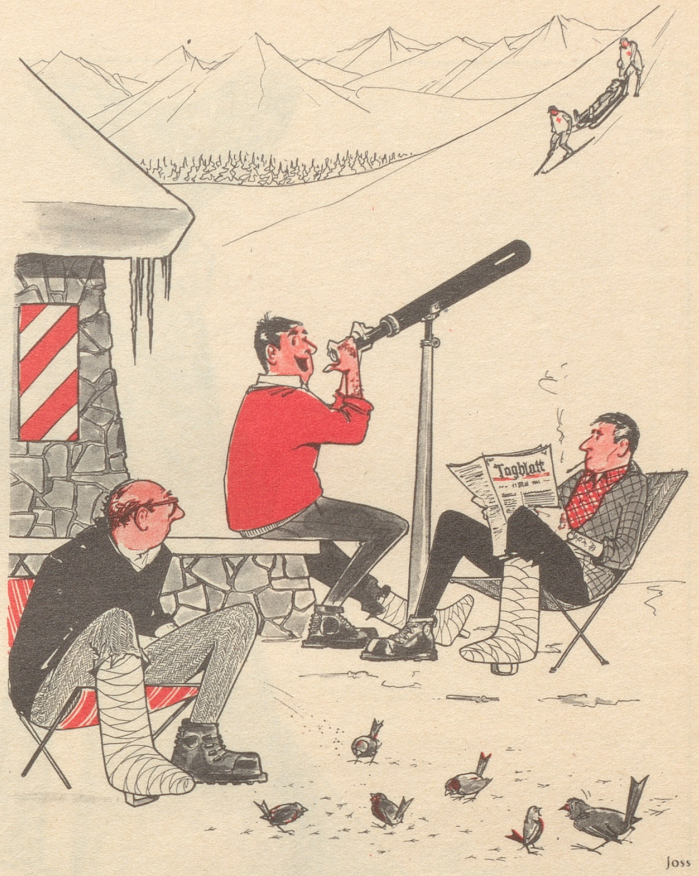
«Jetzt chönne mir äntlig schiebere, Manne, sie bringe der Chöbi!»