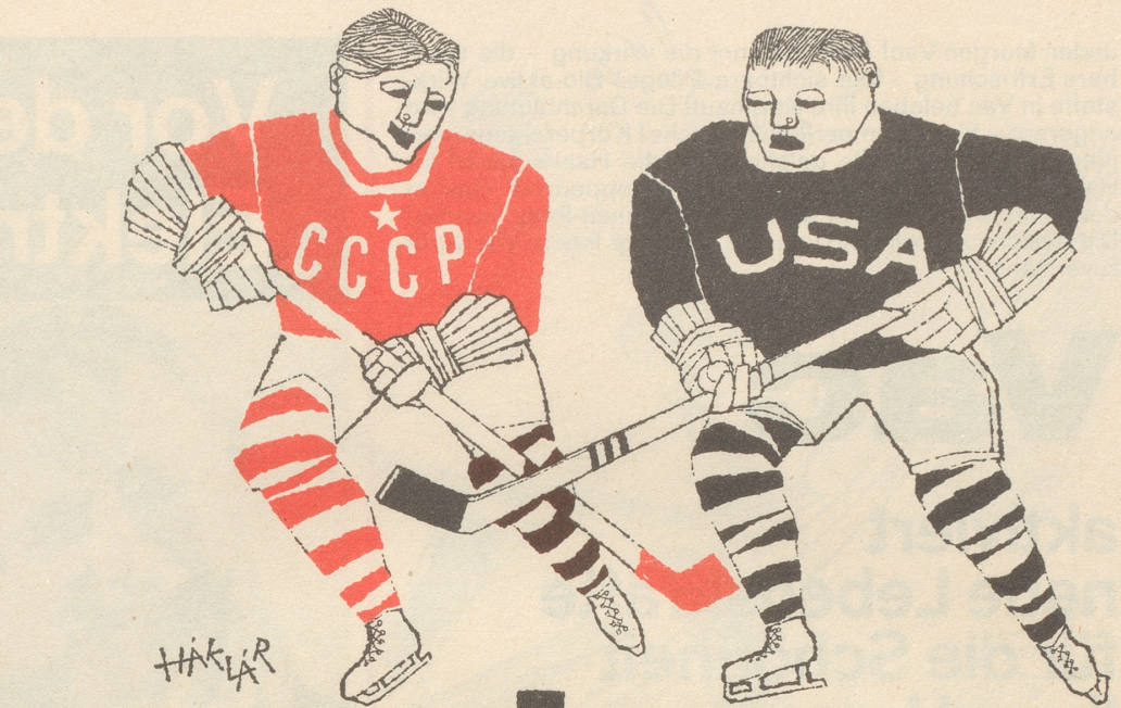
Der kalte Krieg