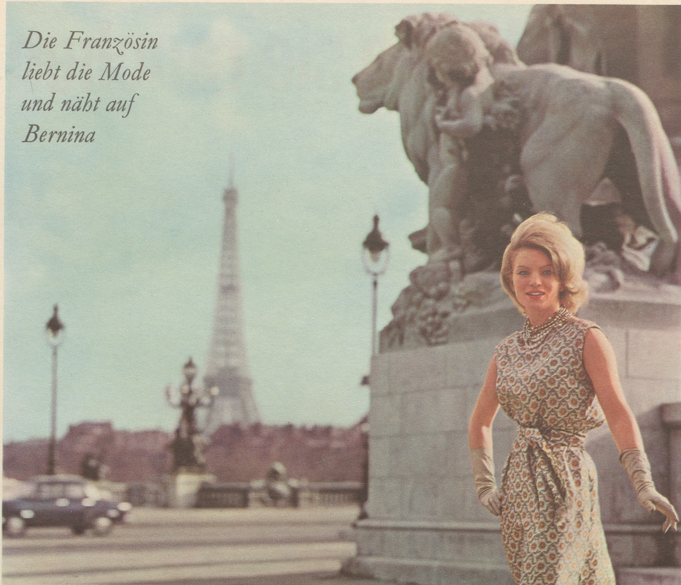
Boulevard-Café in Paris / Begehrt in ganz Frankreich als Qualitätsnämaschine ist BERNINA, die weltbekannte Schweizer Marke.

Die Französin liebt die Mode und näht auf Bernina