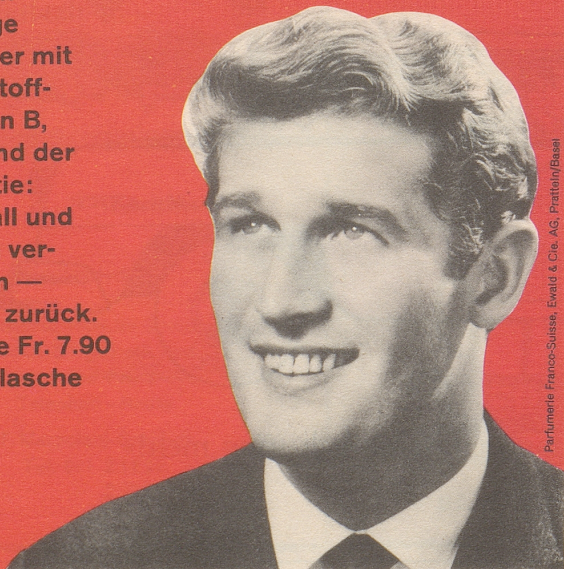
Parfumerie Franco-Suisse, Ewold & Cie. AG, Pratteln/Basel

FS-Brennessel-petrol-Konzentrat - ein Spitzenprodukt vom Fachmann empfohlen! Das einzige Haarwasser mit den Wirkstoff-Komplexen B, F und H und der FS-Garantie: Haarausfall und Schuppen verschwinden — oder Geld zurück. Kurflasche Fr. 7.90 Standardflasche Fr. 5.90