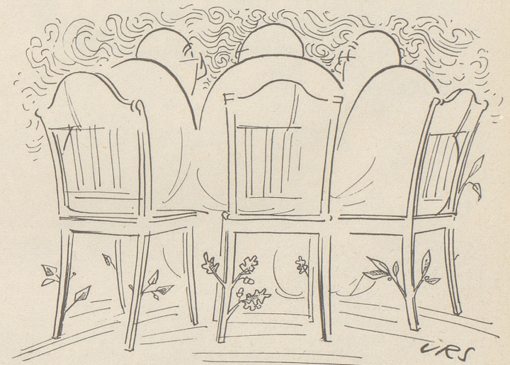
Endlich eine ersprießliche Konferenz!