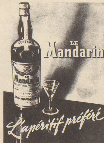
Société Anonyme E. Cusenier fils aîné Bâle 13