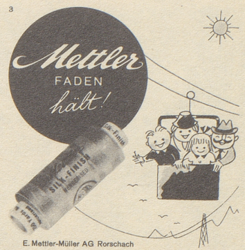
E. Mettler-Müller AG Rorschach

Zuschriften für die Frauenseite sind an folgende Adresse zu senden: Bethli, Redaktion der Frauenseite, Nebelspalter, Rorschach. Nichtverwendbare Manuskripte werden nur zurückgesandt, wenn ihnen ein frankiertes Retourcouvert beigelegt ist.