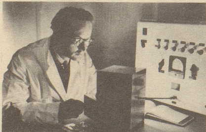
Wissenschaftlich bewiesen: Die Aufbaustoffe von Neo-Silvikrin gelangen bis in die Haarwurzeln!

Bestimmt haben auch Sie schon dies oder jenes unternommen, um den Haarausfall aufzuhalten... und das Ergebnis??? Jetzt endlich brauchen Sie nicht mehr den Mut zu verlieren, denn es gibt ja Neo-Silvikrin — die auf der ganzen Welt anerkannte biologische Haarnahrung! Die erste Voraussetzung für die Wirksamkeit eines Haarpräparates ist: Seine Wirkstoffe müssen bis in die Haarwurzeln gelangen!