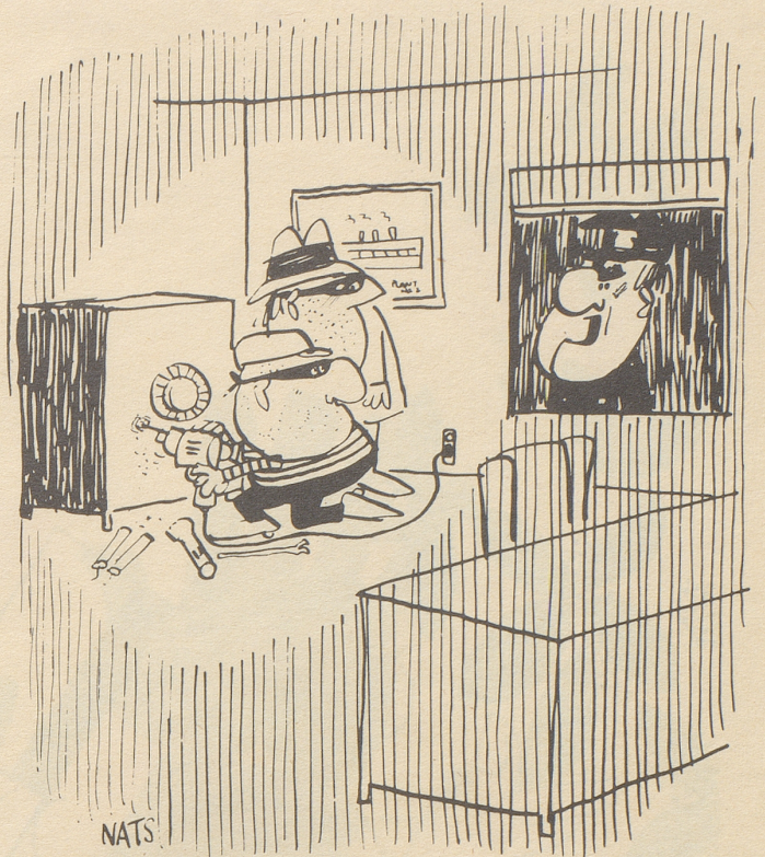
«Hört auf mit diesem Nachtlärm! Und überhaupt: ihr habt hier gar nichts zu suchen!»

Aus einem Inserat in einer Allgäuer Zeitung: «Winterferien für Natur- und Wanderfreunde, abseits des Touristenverkehrs, äußerst bis beängstigend ruhig.» Argus