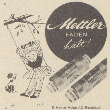
E. Mettler-Müller AG Rorschach

Zuschriften für die Frauenseite sind an folgende Adresse zu senden: Bethli, Redaktion der Frauenseite, Nebelspalter, Rorschach. Nichtverwendbare Manuskripte werden nur zurückgesandt, wenn ihnen ein frankiertes Retourcouvert beigelegt ist.