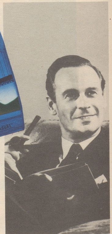
Golden Gate ist mild, mit reichem Aroma und kühlem Rauch. Frischhaltebeutel 45g Fr. 1.70, Dose 300g Fr. 10.50. Machen doch auch Sie einen Versuch.