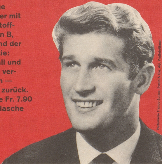
Parfumerie Franco-Suisse, Ewald & Cie. AG, Pratteln/Basel

FS-Brennessel-petrol-Konzentrat - ein Spitzenprodukt vom Fachmann empfohlen! Das einzige Haarwasser mit den Wirkstoff-Komplexen B, F und H und der FS-Garantie: Haarausfall und Schuppen verschwinden — oder Geld zurück. Kurflasche Fr. 7.90 Standardflasche Fr. 5.90