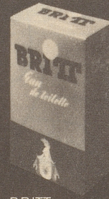
BRITT Eau de Toilette 80°