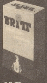
BRITT nach dem Rasieren