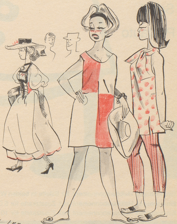
«Schampar wi die sech uffällig aleit!»