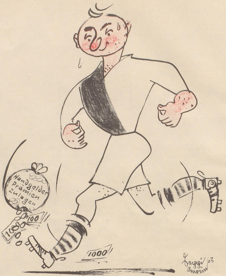
«Gschpäßig: ich bi doch kei Profi — aber tschutte chani nor weni Gäld gsehne . . . »