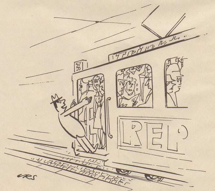
«Darf ich Sie um die Hand Ihrer Tochter bitten — wenigstens bis zum Bahnhof? »

Feuer breitet sich nicht aus, hast Du MINIMAX im Haus!