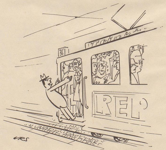
«Darf ich Sie um die Hand Ihrer Tochter bitten — wenigstens bis zum Bahnhof? »

Feuer breitet sich nicht aus, hast Du MINIMAX im Haus!