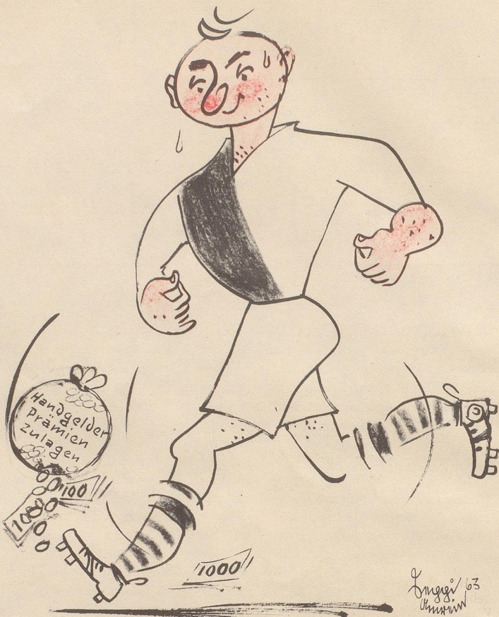
«Gschpäßig: ich bi doch kei Profi — aber tschutte chani nor weni Gäld gsehne . . . »