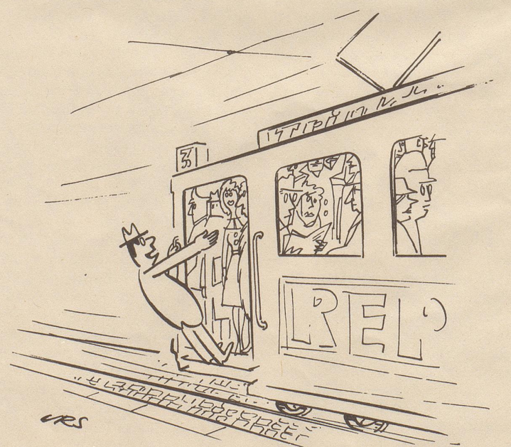
«Darf ich Sie um die Hand Ihrer Tochter bitten — wenigstens bis zum Bahnhof? »

Feuer breitet sich nicht aus, hast Du MINIMAX im Haus!