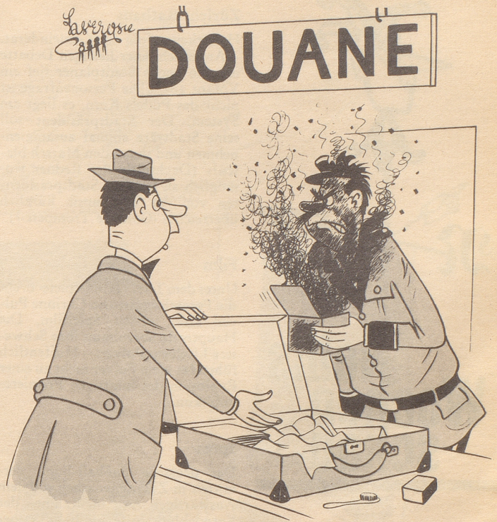
«Habe ich Ihnen etwa nicht gesagt, es sei ein Scherzartikel drin?»