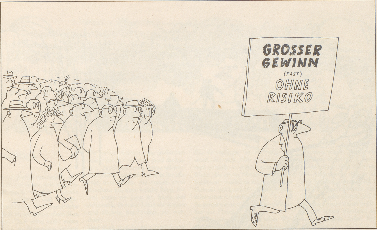
Gar mancher sucht im Geld sein Heil . . .