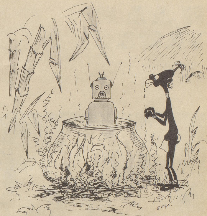
Nachteil der Technik

Truman bei seinem Rücktritt im Jahre 1953: «Am Tage, da ein Mann zum Präsidenten gewählt wird, findet er sich plötzlich auf dem Dach der Welt. Dort sitzt er eine Weile, hält das Schicksal von Millionen in der Hand, fällt Entscheidungen, die Geschichte machen, und dann – ganz plötzlich – ist er wieder unten.»